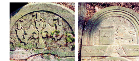
Ozdobne elementy macewy