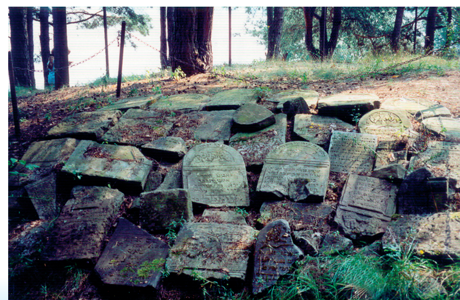
Macewy z żydowskiego cmentarza