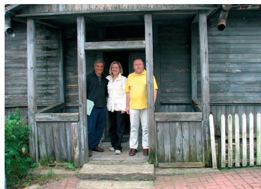
Na ganku dawnej, serockiej szkoły