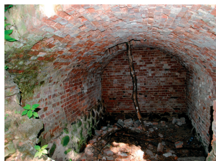
Piwnica magazynu przy młynie