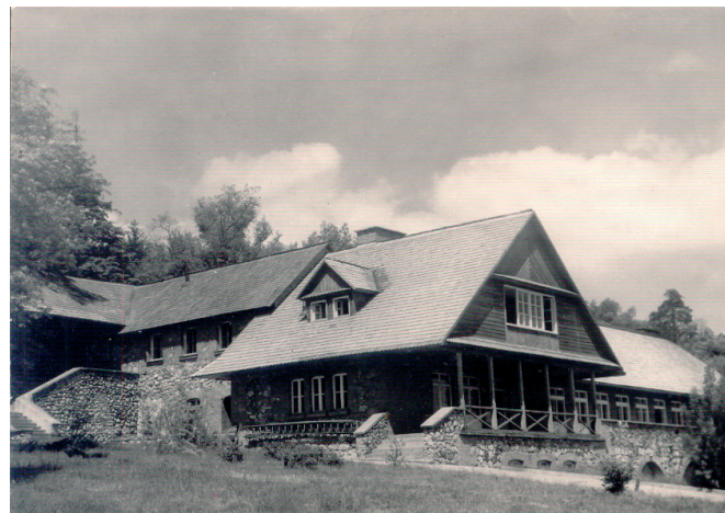
Hotel PTTK na pocztówce 1962 r.