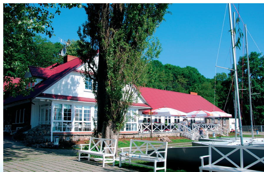
Przystań żeglarska w Klubie Miła.