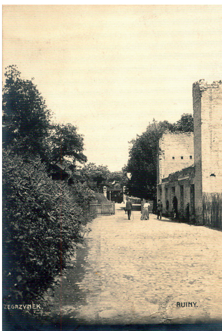
Ruiny młyna na pocztówce wysłanej w 1910 r. z Serocka do Londynu