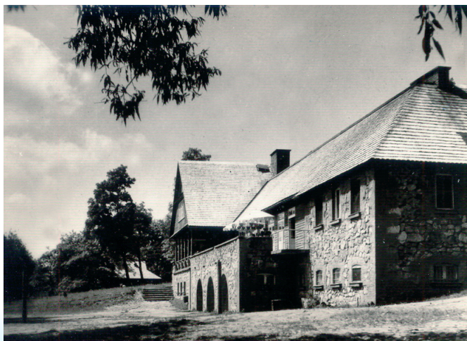
Hotel PTTK na pocztówce z 1961 r.