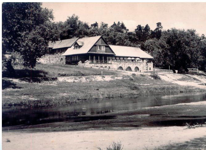
Hotel PTTK na pocztówce z 1961 r.

Najważniejsza była jednak inicjatywa utworzenia obowiązkowej szkoły dla dzieci pracowników młyna,