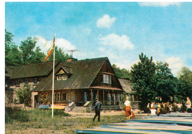
PTTK na pocztówce z 1966 r.